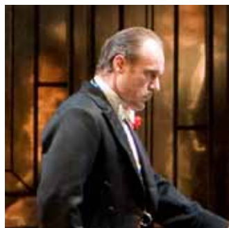
Baron Douphol Baritôn / hebryngydd Violetta a gelyn Alfredo