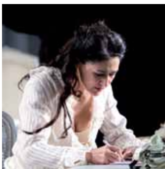
Violetta Valéry Soprano / putain llys