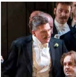
Gastone de Letorières Tenor / ffrind Alfredo, larll